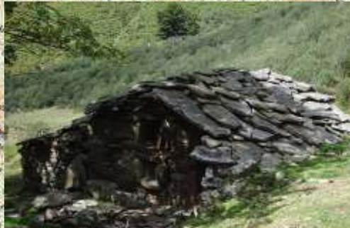
Foto: Cabaña junto al camino

El camino discurre entre bosques y prados salpicados de viejas cabañas, algunas muy bien conservadas, que utilizaban los pastores de estos pueblos en sus estancias estivales con el ganado en los pastos de altura.