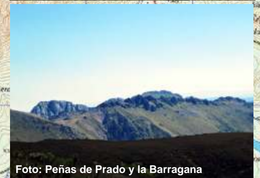
Foto: Peñas de Prado y la Barragana